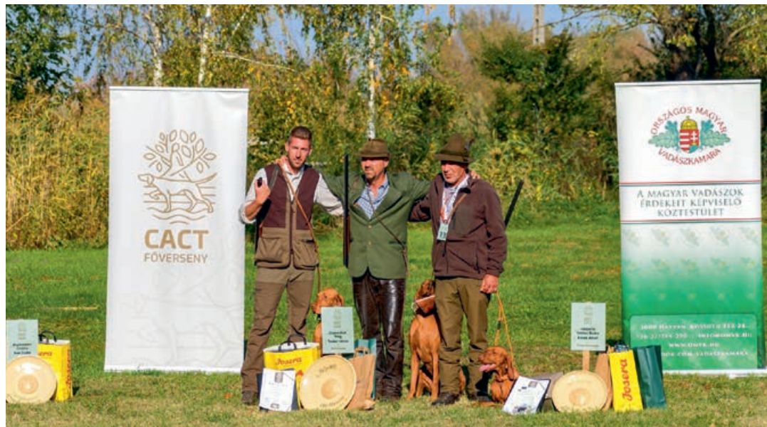
A Vizsla Főverseny dobogósai

Az Országos Magyar Vadászkamara által megszervezett 2016-ban újjaélesztett Vizsla Főversenyt 2022-ben október közepén rendezték meg Sáregres-Rétimajorban. Bár Veszprém megye nem kimondottan apróvadászterületeiről híres, a megmérettetésen megyénk indulói mégis az élvonalban végeztek!