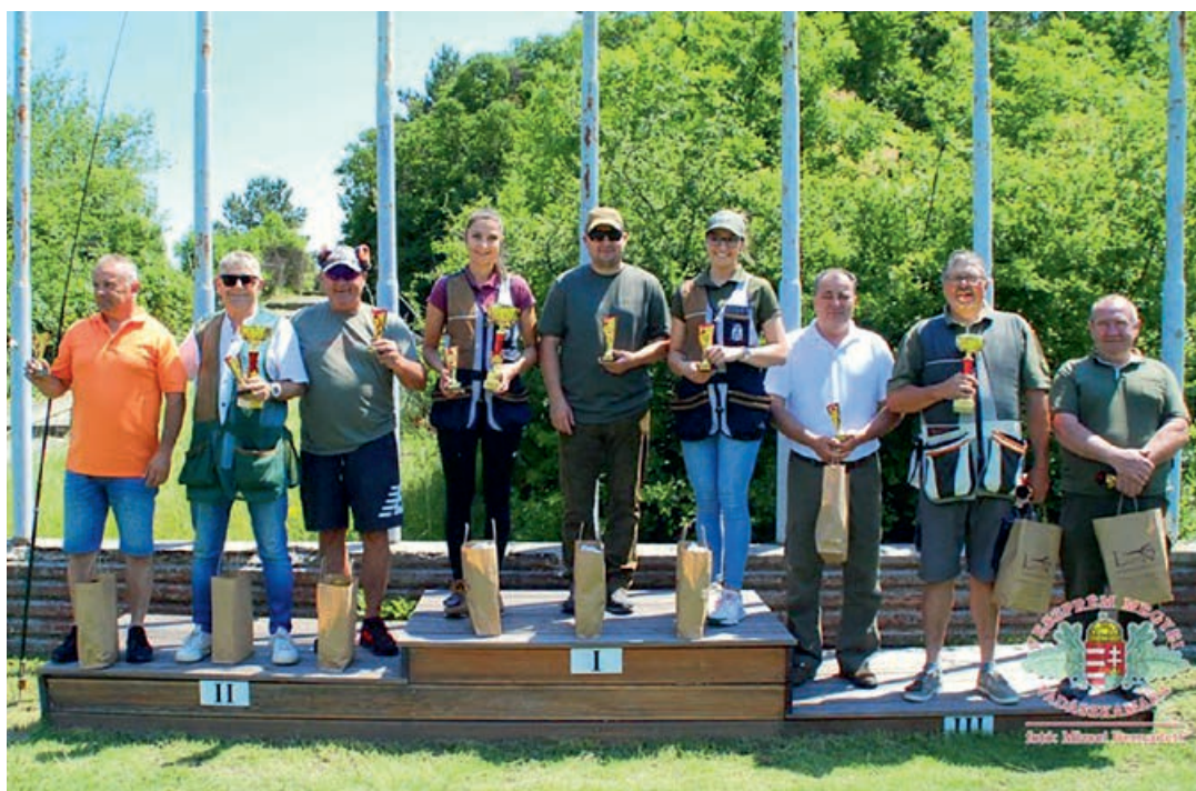
A csapatverseny dobogósai

Ha van „állócsillag” a Veszprém Megyei Vadászakamara által szervezett programok között, akkor a vadásznapok mellett a Kamarai Nagydíj nevet viselő löverseny az, hiszen idén már huszonötödik alkalommal rendezték meg Balatonfűzfőn.