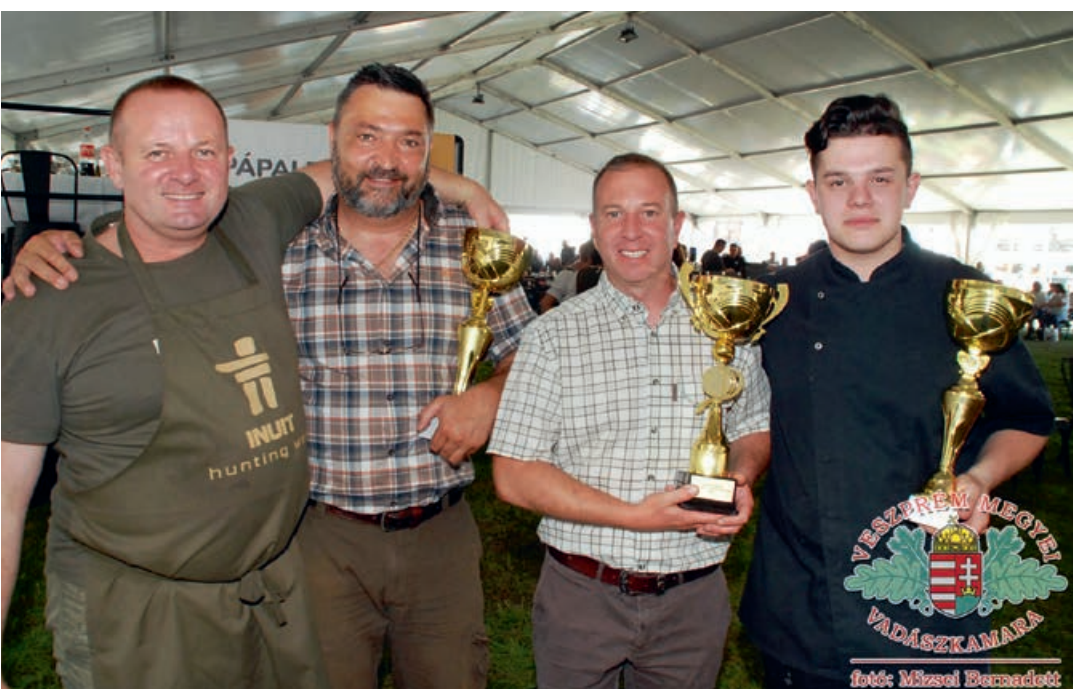
Sikeres főzőnk egy csoportja