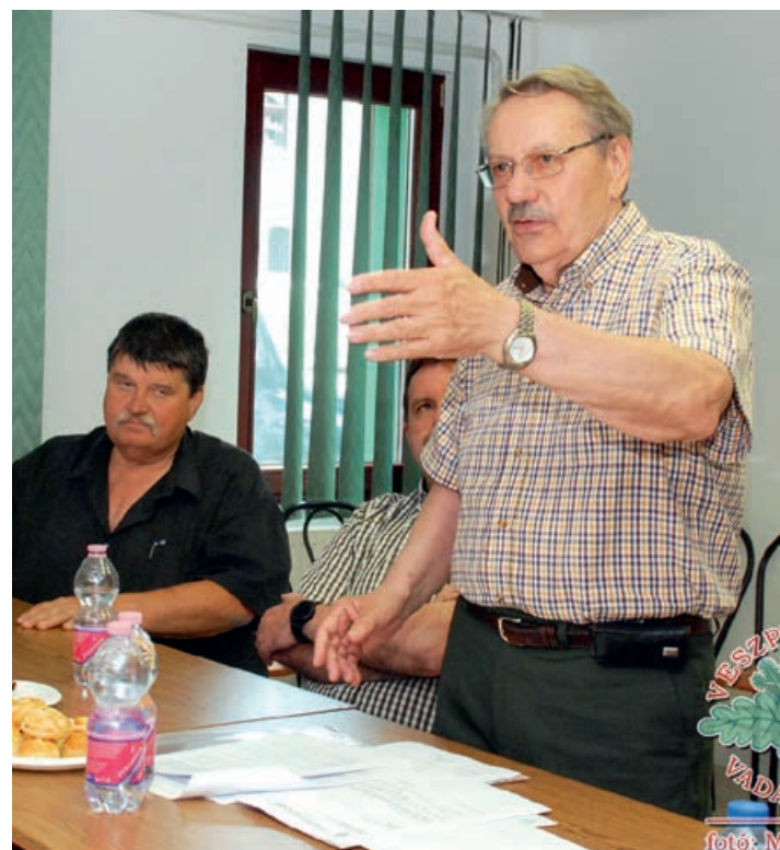
Az elnöki beszámoló pillanatai

Összevont megyei küldöttgyűlést tartott a Veszprém Megyei Vadászkamara és a Vadászszövetség május 25-én a megyei érdekképviselet Dózsa György utcai székházában. Az összejevetel témája a 2021-es évi szakmai és pénzügyi beszámoló elfogadása és a 2022-es esztendőre szóló tervek ismertetése, majd megszavazása volt.