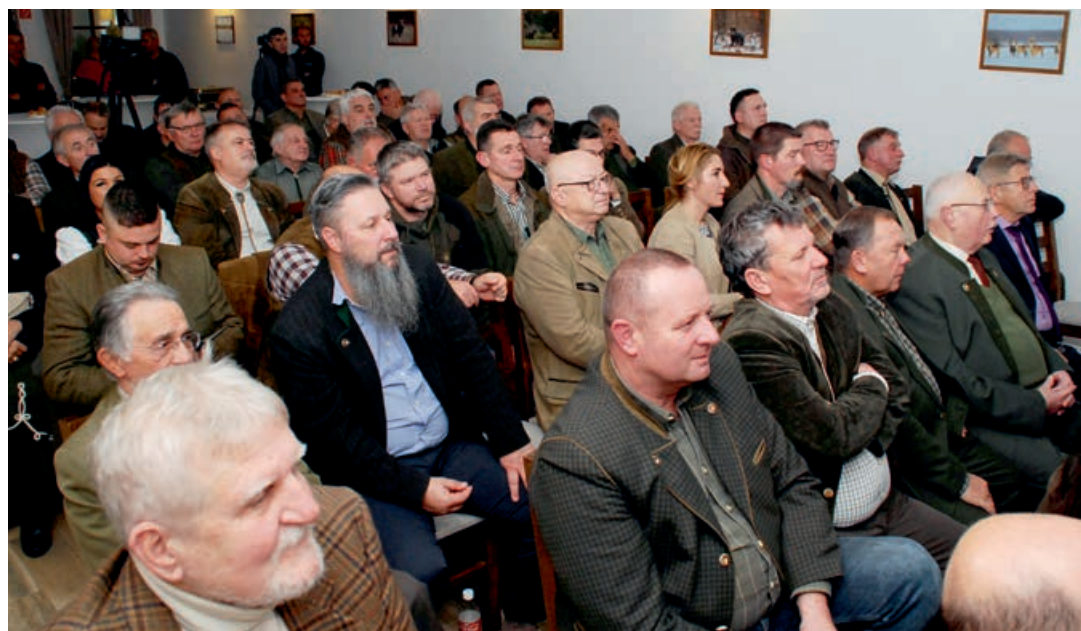
Az alsóperai évadzáró vadászati fórum résztvevői