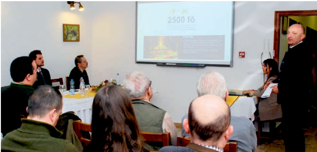
Takács Szabolcs főispán előadása

A korábbi évektől eltérően a megszokott odvaskői helyszínt a Verga Zrt. vendégszeretetének köszönhetően az alsópereni rendezvényházra cserélve gyűltünk össze november 25-én, hogy számot vessünk a lassan magunk mögött hagyott esztendő eredményeiről, sikereiről és kihívásairól.