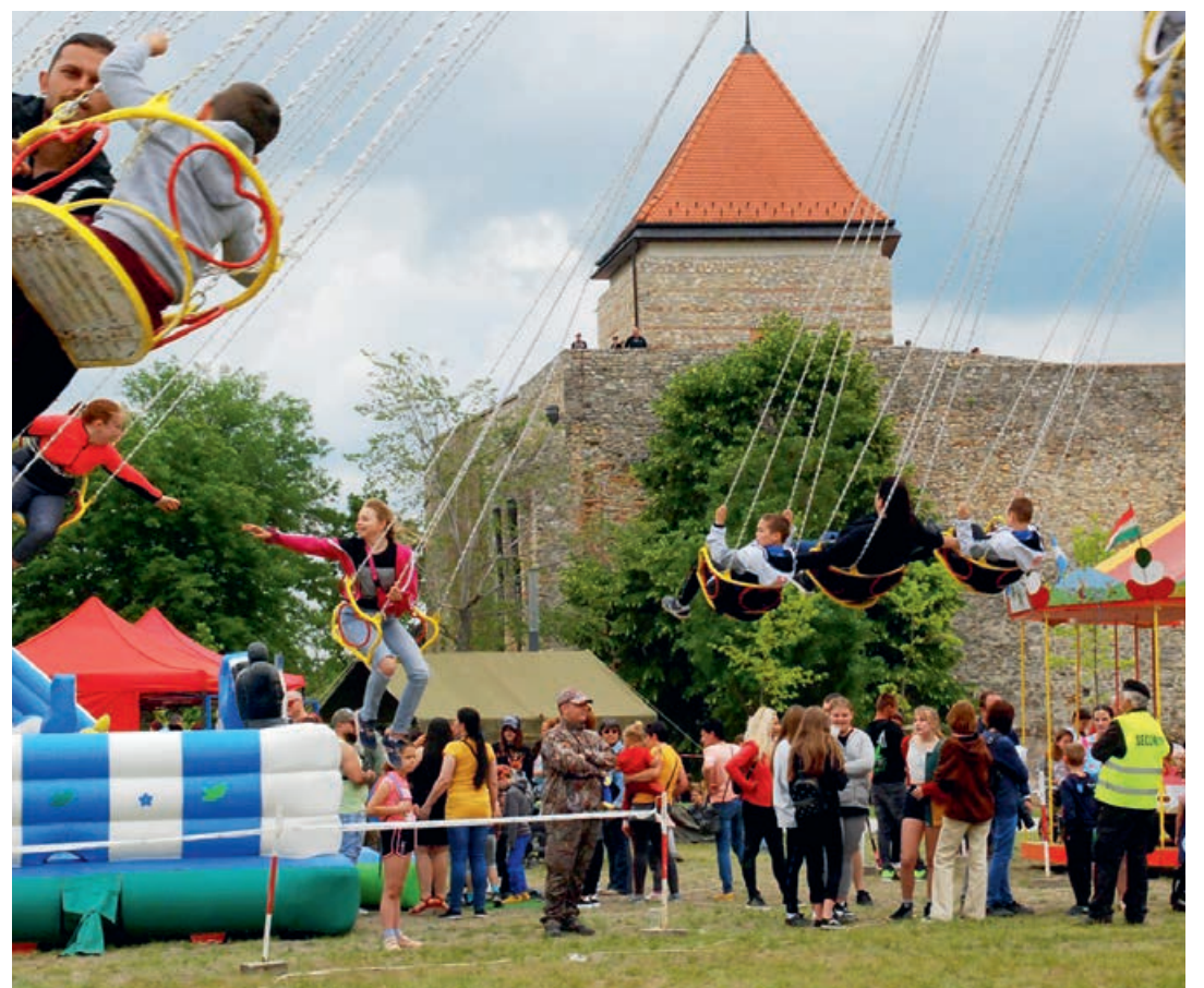
Önfelelt gyerekek a várpalotai vadásznapon