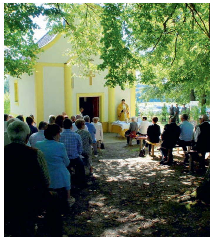
Hubertus-mise a Mária-kápolnánál