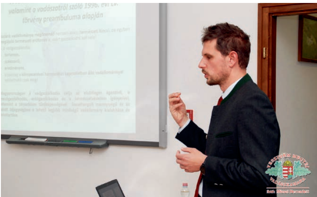
Kovács Ferenc, az Agrárminisztérium Vadgazdálkodási Főosztályának vezetője

Befejezésül a Tájékoztató kiállítását tekintettük meg, aminek alapját a Zselic adta, de a Világkiállításról is érdekes anyagot kaptak. Jó hangulatú, izgalmas szakmai programokban bővelkedő, remélhetőleg hasznos kirándulást töltöttünk el Bőszenfán!