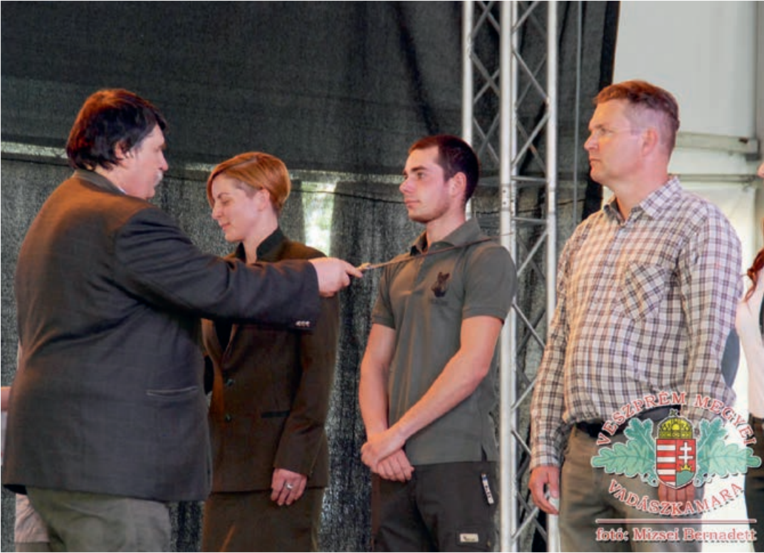
Ifjú vadászok fogadalomtétele Pápán

A vírushelyzet csillapodásával a vadászati rendezvények terén is visszazökkenni látszik az élet a régi kerékvágásba: a farsangi Erdész-Vadász Bál ugyan még elmaradt, de a Pápai Agrárexpo keretein belül május 14-én tartott vadásznapi már minden adott volt a tartalmas időtöltéshez.