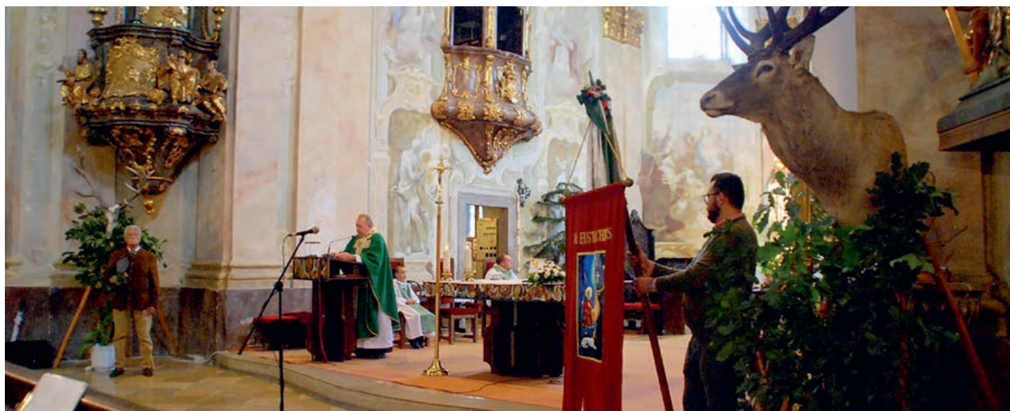
A Szent Euszták tiszteletére bemutatott mise pillanatai

Idén 17. alkalommal tisztelegtek a résztvevők az érett bor és a vadászat előtt a Jakab Napok keretében. A színes programkavalkád és a főzőverseny mellett két év kihagyás után lövészversenyt is hirdettek, kétfajta versenyszámban.