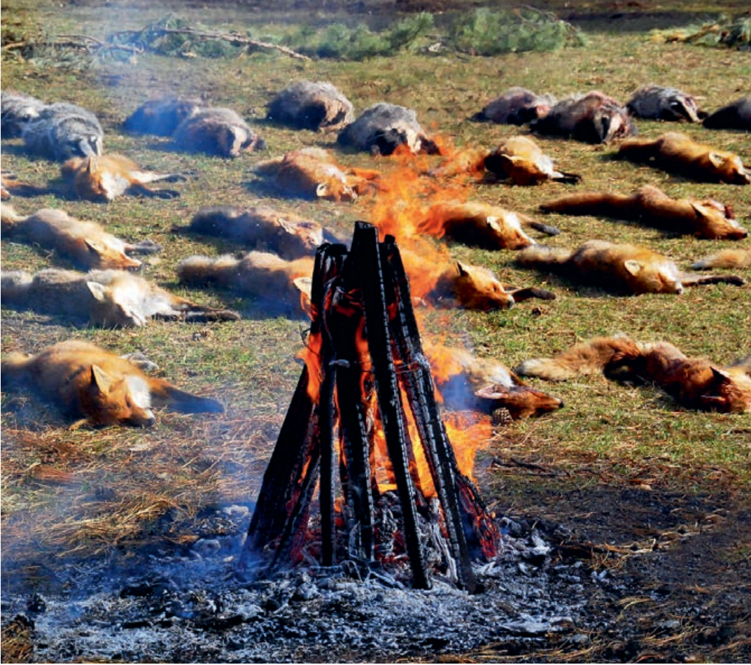
Dúvadteríték a hidegkúti vadászháznál

2022. február 25-én már ötödik alkalommal adhatták meg közösen a végtisztességet az apróvadat „dézsmáló” fajok terítéke előtt a Balaton-felvidéki vadgazdálkodási tájegység jogosultjai. Minden évben más és más helyen gyűlünk össze, hogy a dúvadhat eredményeinek értékelése mellett arra is alkalmunk legyen, hogy a házigazda vadászatra jogosult adottságait, praktikáit megismerve tapasztalatot cseréljünk. Idén erre a Bakonyerdő Zrt. Hidegkúti vadászháznál nyílt lehetőség.