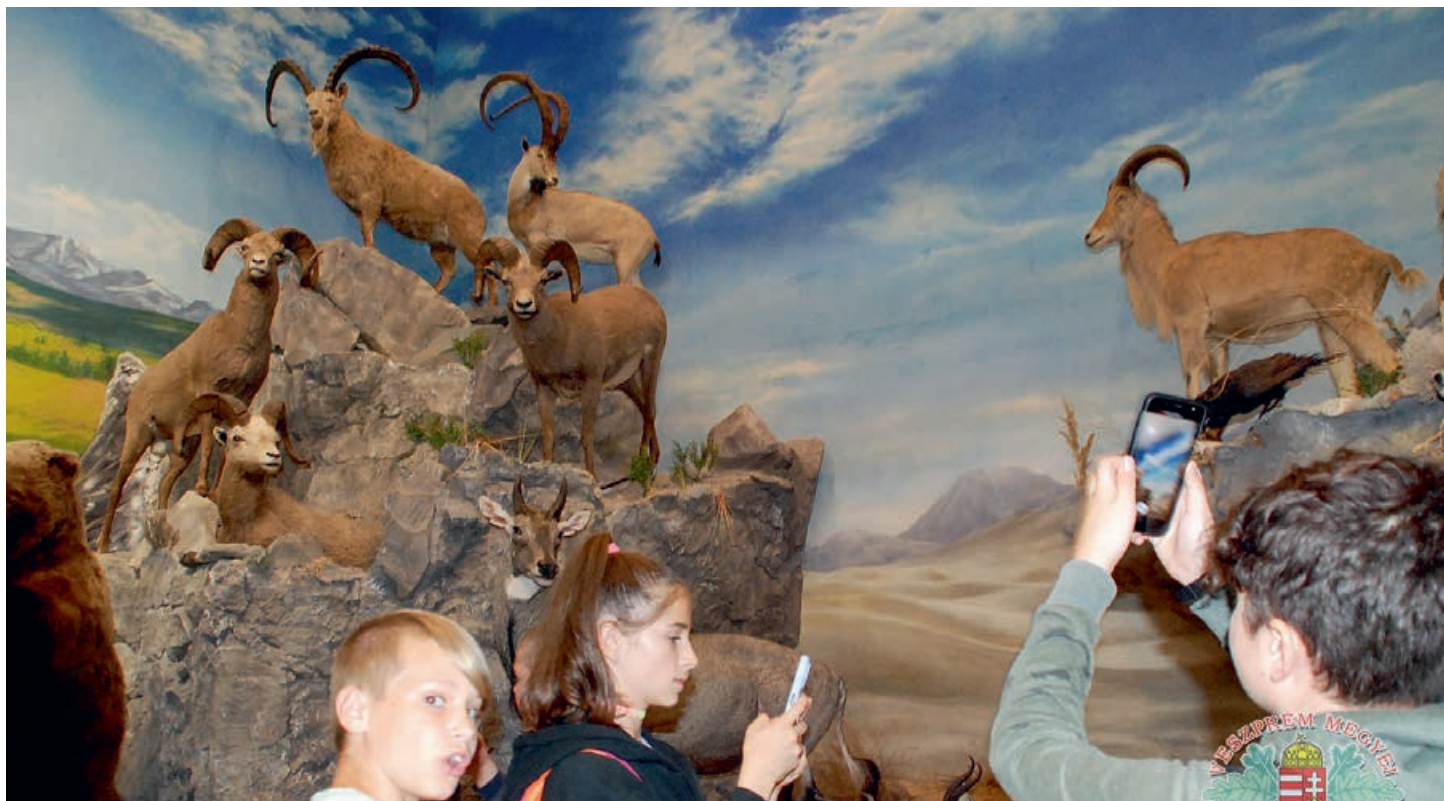
A Vadászati Múzeum diorámájánál

A kamara az ötödik évfolyamot vendégül is látta az egyik keszthelyi étteremben, és hogy a nap teljes legyen, a gyerekek kedvence, a fagyis sem maradhatott el!