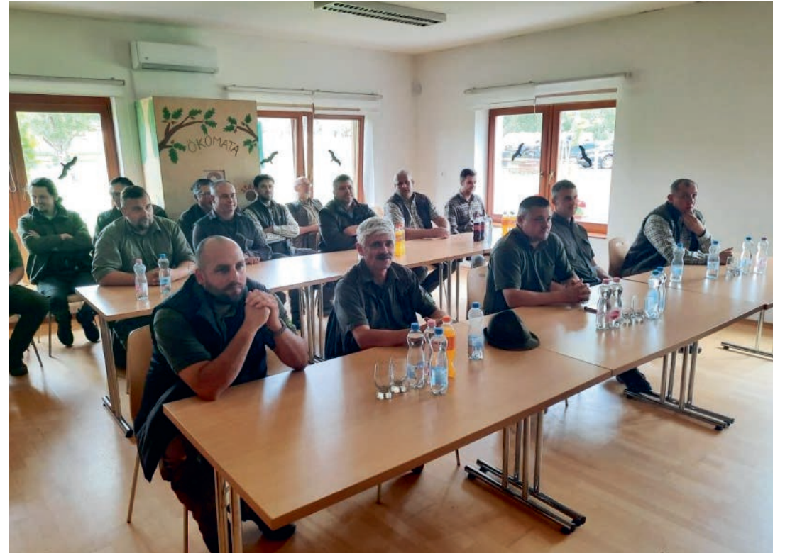
Hivatásos vadászok az elméleti megmérettetésen

A Veszprém megyei hivatásos vadászok éves szakmai versenye 2022. június 9-én került megrendezésre a Bakonyerdő Zrt. Természet Háza Látogatóközpontjában Gyenesdiáson.