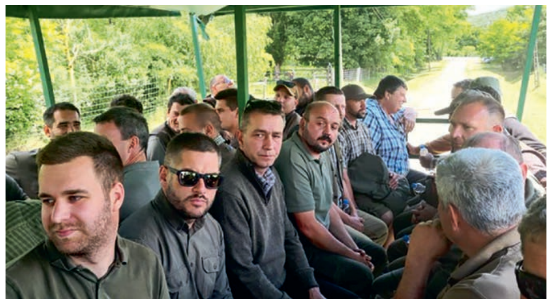
A terepbejárást a szarvasfarmon turistákat is szállító traktorról oldották meg

A Veszprém Megyei Vadászkamara 2022. június 2-ára egész napos tanulmányutat szervezett – és teljes mértékben finanszírozott – a MATE Vadgazdálkodási Tájékoztató, a bőszenfai szarvasfarmra. A szakmai kiránduláson 50 fő vett részt.