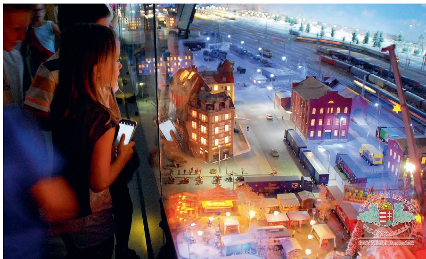
A modellvasút-kiállítás megtekintése

Újabb kirándulást szervezett a Pápai Erkel Ferenc Ének-Zenei Általános Iskola tanulói számára a Veszprém Megyei Vadászkamara. Ezúttal június 13-án másodikosokat láttak vendégül Keszthelyen, akik először élhették át, milyen is egy igazi osztálykirándulás.