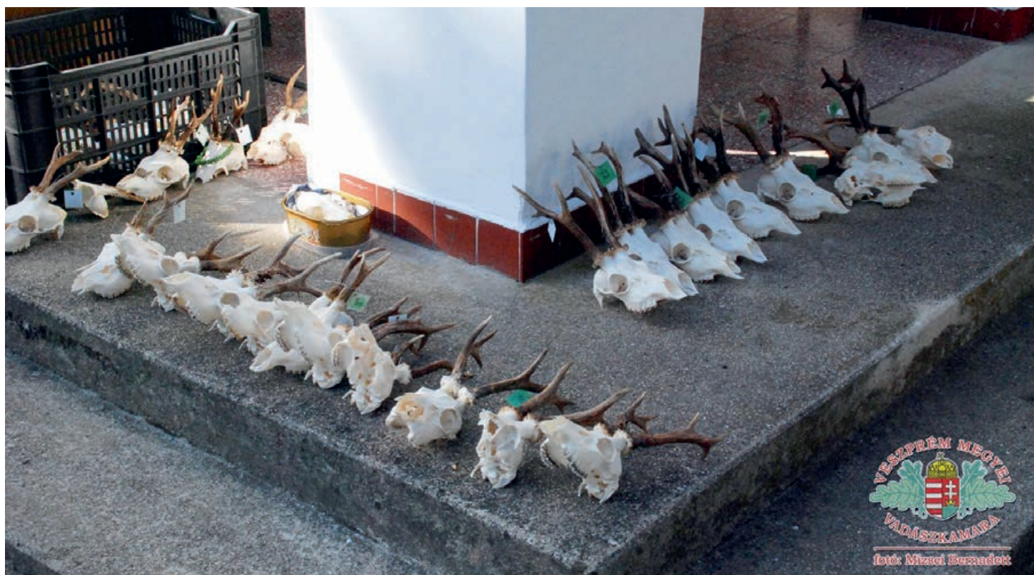
Bírálatszerelésre váró trófeák az Artemisz vadászházánál