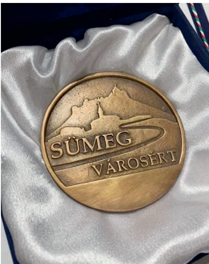
A Sümeg Városért emléklap

Sümeg Város Önkormányzatának Képviselő-testülete a 2022. október 27-ei ülésén a városi kitüntetések adományozásáról döntött.