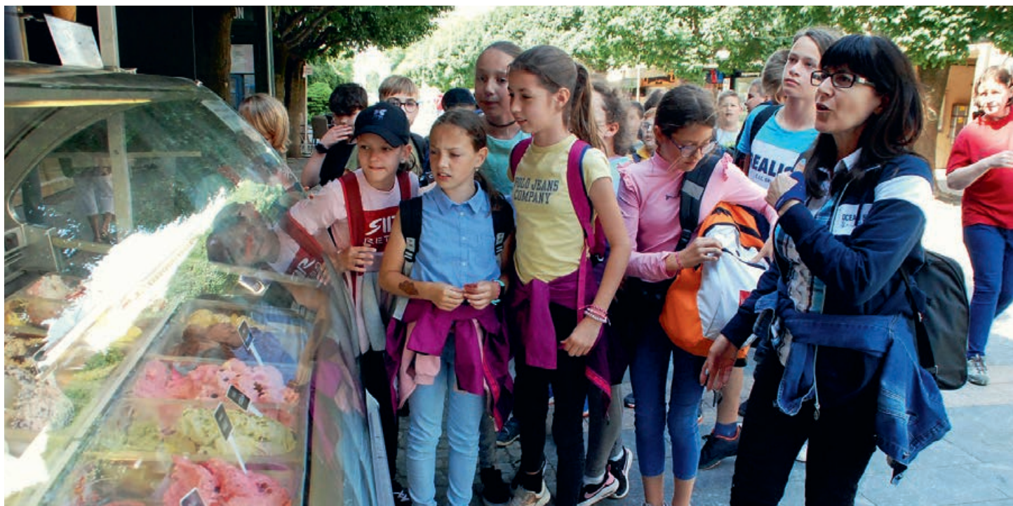
Fagylalozás a keszthelyi sétálóutcában