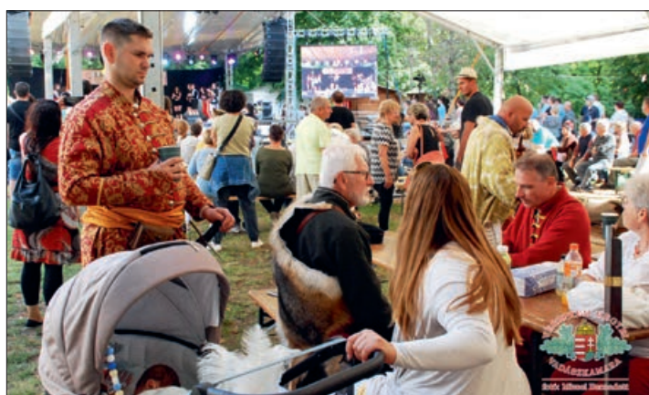
Sokadalom a püspöki palota kertjében

A rendezvényen megjelent dr. Navracsics Tibor területfejlesztési és az uniós források felhasználásáért felelős tárca nélküli miniszter, a rendezvény fővédnöke, aki úgy fogalmazott: a Jakab Napok az életöröm ünnepe, hiszen mi más lehetne annál nagyobb tisztelet az életnek, mint a vadászat és a jó minőségű, finom, tartalmas bor fogyasztása. – Ha ez igaz, akkor Sümeg a legjobb hely az életöröm ünnepeinek! Sümeg csodálatos, és történelmének ezernyi mozzanata