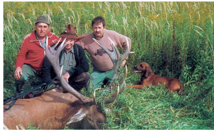
Ilyen és ehhez hasonló 12 kiló fölötti bikák gyakran kerülnek terítékre a Marcal-Bitva-közi Vadásztársaságnál

Az őzállomány 550, a disznóállomány 300 darabos. A területükön van egy majd 250 hektáros disznókertjük, ahol 60–70 darab vaddisznó lehet. Az apróvadállomány kevés, nyúl szinte nincs a területen, a fogoly, a fácán szerencsére feljövőben van. Éveken keresztül foglalkoztak fácánneveléssel, de az idén befejezték,