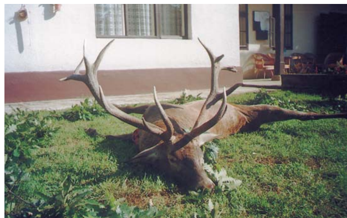
A tavalyi megyei rekorder bikát az osztrák Kurt Wilde lőtte

Az éves tervük szerint 100-110 szarvast ejtenek el, amiből 25-28 a bika. Az idén nem volt köztük aranyérmes tróféájú. Őzből 150-et lónek, köztük 45 bakot, de ebből sem akadt arany. Disznóból 170 a terv. Egyébként pár éve meg 300-at lótték belőle, de az állomány mára rendkívüli módon lepadt. Az idei kilövésekkel 120-nál tartanak. A disznókárokon is látszik a csökkenés, az idén például a kukoricát nem túrtá ki. A vadászok kijelentették, a területen nincs túlszaporodott vadállomány, főleg most, hogy a disznók száma radikálisan csökkent. Éppen ezért abban érdekeltek, hogy a jelenlegi szint minimálisan megmaradjon. Szerintük szakmai szelekcióval javítani kell a szarvasállomány minőségén.