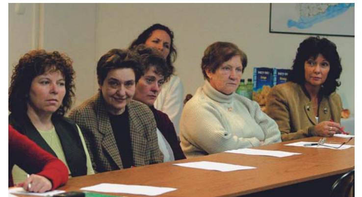
Sokan elfogadták a meghívást, így megalakult a megyei Diana Vadászklub

A Veszprém megyei vadászklub a felsorolt nemes és