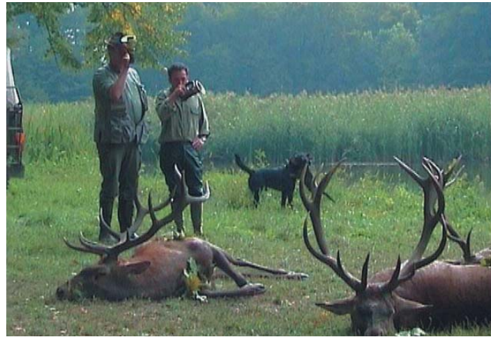
Egy szép teríték a közelmúltból. Remélik, nem csak emlék marad

A vadászati árak lefele mozognak, köszönhetően az éles versenynyél. Ezzel szemben a költségek az ég fele szöknek. A vadásztársaságok mindegyike a létéért küzd, s árban egymás alá ígérnek, hogy legyen bevételük. Egyes vadásztársaságok a középkereset, ígéretes bikákat is meglövetik, tönkretéve a jövőt. Ezzel azonban a saját és a másik sírját is ássák.